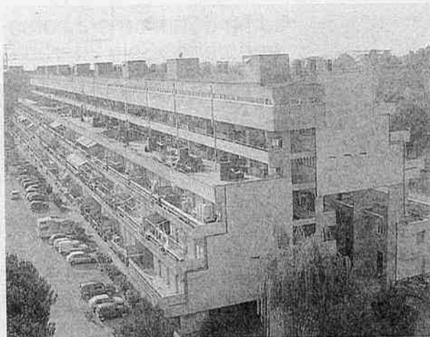
Il fabbricato Ater: il Casermone

Il percorso avviato ricalca quello indicato dall'assessore regionale alle Politiche della Casa, Teodoro Buontempo, che nel suo indirizzo politico ha indicato tra le priorità l'abbattimento di questi "mo-